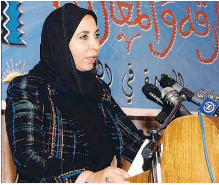
• سعاد الصباح

يؤكد الشيباني في كتابه أنه يقدم بعض الصور والمواد والوثائق التي تنشر لأول مرة، وتظهر بعضاً من الأسرار الخفية، لا سيما الطبية منها، مشيراً إلى أنه جمع كتابه هذا من مصادر شتى.