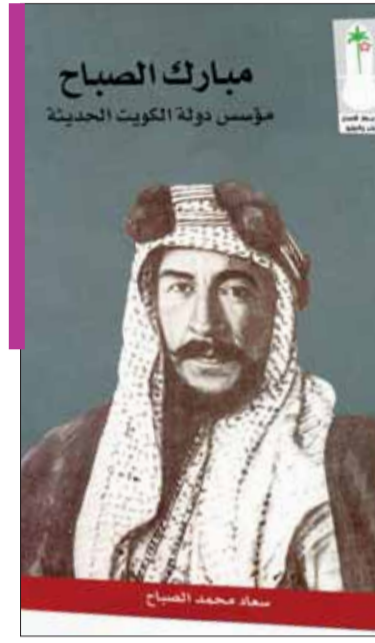
• غلاف كتاب «مبارك الصباح»

«أكد استقلال الكويت وأبرز دورها على خريطة المنطقة شخصية فاعلة متفهمة لمجريات الأحداث التي عاصرتها»